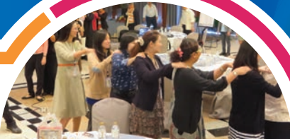
ผู้เข้ารับการอบรมกำลังเล่น Piglet game ซึ่งเป็นส่วนหนึ่งของกิจกรรมเพื่อพัฒนาสมรรถนะของหลักสูตรด้านความร่วมมือและพันธมิตรในรายวิชาที่ออกแบบโดยกลุ่มย่อย

ส่งเสริมให้ผู้เข้ารับการอบรมให้แสดงความรู้สึกและความคิดเห็นเกี่ยวกับการอบรมในแต่ละวัน โดยการโพสต์ข้อความระบุความต้องการของผู้เข้าอบรม