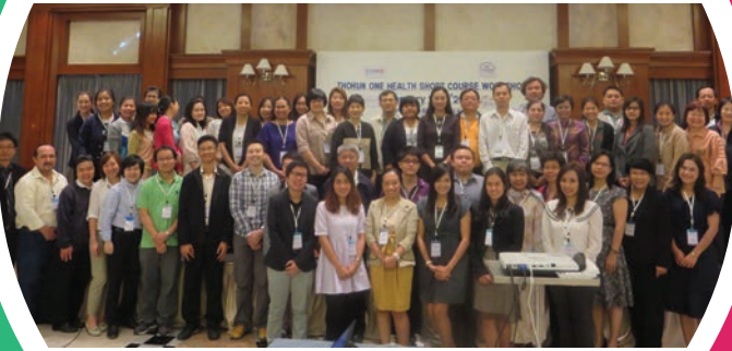
ผู้เข้ารับการอบรมทั้งหมด

ครูฝึกในการอบรมในครั้งนี้ เป็นผู้ที่ได้รับการคัดเลือกจากผู้ที่ผ่านการฝึกอบรมเพื่อพัฒนาครูฝึกของ THOHUN ก่อนหน้านี้ ซึ่งมีผู้เข้ารับการอบรมจำนวน 41 ท่าน จากคณะเศรษฐศาสตร์ คณะแพทยศาสตร์ คณะพยาบาลศาสตร์ คณะสัตวแพทยศาสตร์ คณะสิ่งแวดล้อมและทรัพยากรศาสตร์ คณะสาธารณสุขศาสตร์ คณะเวชศาสตร์เขตร้อน คณะการจัดการสิ่งแวดล้อม จาก 6 มหาวิทยาลัยสมาชิก คือ มหาวิทยาลัยเชียงใหม่ จุฬาลงกรณ์มหาวิทยาลัย มหาวิทยาลัยเกษตรศาสตร์ มหาวิทยาลัยขอนแก่น มหาวิทยาลัยมหิดล และมหาวิทยาลัยสงขลานครินทร์