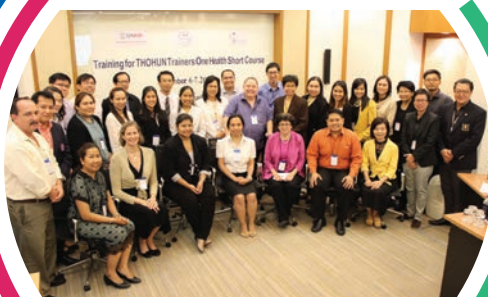
ครูฝึกและผู้เข้าร่วมอบรม

การอบรมครั้งนี้ มีวัตถุประสงค์เพื่อผลิตครูฝึก ที่มีความรู้ความเข้าใจอย่างลึกซึ้ง ในแนวคิดของสุขภาพหนึ่งเดียว รวมถึงเนื้อหาและเทคนิคการสอนเชิงนวัตกรรมต่างๆ ที่ปรากฏใน SEAOHUN One Health Short Course modules ตลอดจนวิธีการถ่ายทอดความรู้ให้แก่สมาชิก THOHUN ในการอบรมครั้งต่อไป อย่างมีประสิทธิภาพ