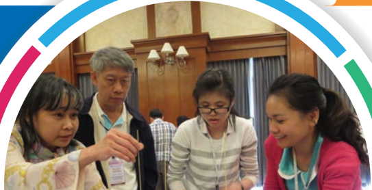
ผู้เข้ารับการอบรมพยายามสร้างให้ตัวโครงสร้างสามารถตั้งได้ ซึ่งเป็นกิจกรรมสาธิตในหน่วยการเรียนรู้ด้านความร่วมมือและพันธมิตร